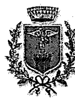
Comune di Mosciano Sant'Angelo