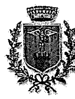
Comune di Mosciano Sant'Angelo