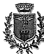
Comune di Mosciano Sant'Angelo