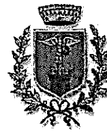
Comune di Mosciano Sant'Angelo