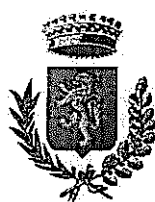
Comune di Bellante